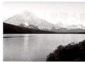
バンフゴンドラから見たバンフの風景